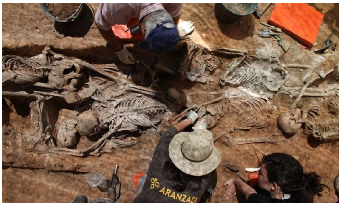
Exhumación en una de las ‘fosas de los ferroviarios’ en Aranda de Duero, en 2011.

La “situación más dramática” cayó sobre “casi 6.800” ferroviarios con penas “desde meses de prisión a cadenas perpetuas”. Y más: “casi un centenar de ellos fue condenado a muerte”. O el exilio, los trabajos forzados como esclavos del franquismo en la construcción de líneas férreas y el internamiento en campos de concentración como Mauthausen.